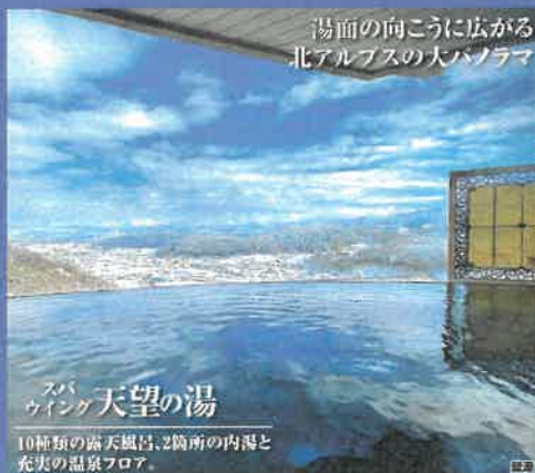
湯面の向こうに広がる 北アルプスの大パノラマ

※このプランは、株式会社JR東海ツアーズが企画・実施する旅行です。この旅行に参加されるお客様は同社と募集型企画旅行契約を締結することになります。旅行の内容、条件などの詳細は、裏面をご覧ください。※このプランは、アソシアリゾートクラブの会員である法人・団体に従事の方がお申込み代表者(契約責任者)となる場合に限り、ご利用可能なプランです。お申込みの際、法人・団体名のご入力が必要です。(お申込み代表者の方ご本人が旅行に参加しない場合もご利用可能です。同行者の方はどなたでもご参加いただけます。)※食事なしプランのため、夕食(事前申込要)、朝食の追加手配はホテルにて承ります。 ホテルアソシア高山リゾート TEL 0577-38-0001(代表)