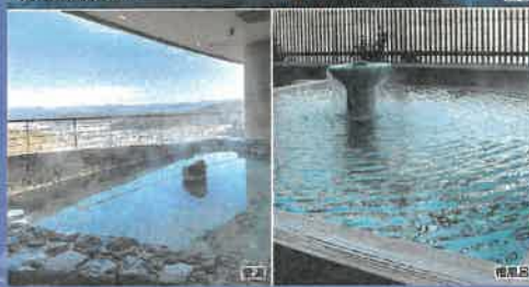
バウイング天望の湯