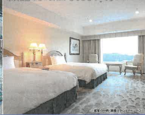
客室の一角(1泊1食プランイメージ)

※赤字の数字は、税別利用する場合、税別で施設使用料が必要となる宿泊施設があります。詳しくはお客様より宿泊施設にお問合わせください。施設において必要な場合の宿泊税・入湯税は旅行代金に含まれておりません。宿泊施設にてお支払ください。行政の旅行自費要請・その他要等に準じ、各施設の休業、営業時間変更やイベント開催中止等が発表される可能性があります。ご利用の際は、事前に各施設の公式ホームページにて最新情報をご確認ください。休業日・営業時間・提供内容等は、都合により事前連絡のないまま変更となる場合がございます。ご出発前にお客様ご自身で各施設にご確認ください。