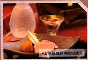
A5等級飛騨牛鉄板焼き