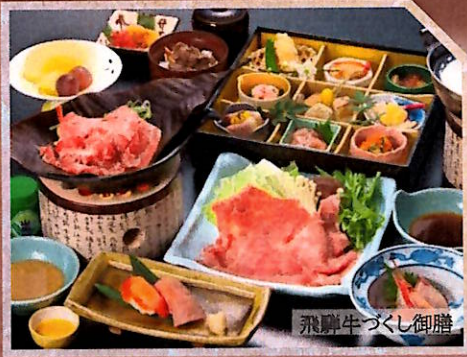
飛騨牛づくし御膳